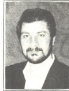
تهیه و تدوین علی اکبر سعیدی کیا

مشتری با مزایای نسبی که امروزه قیمت، کیفیت و تحول به موقع است، بر اساس کیفیت ارضای ذهن مشتری، قدرت و درک آن توسط وی و نهایتاً ارضای ذهن وی می‌باشد. در این زمینه مدیریت دارایی‌های مشتری (CUSTOMER ASSET MANAGEMENT) به مدیریت ذهن مشتری می‌انجامد.